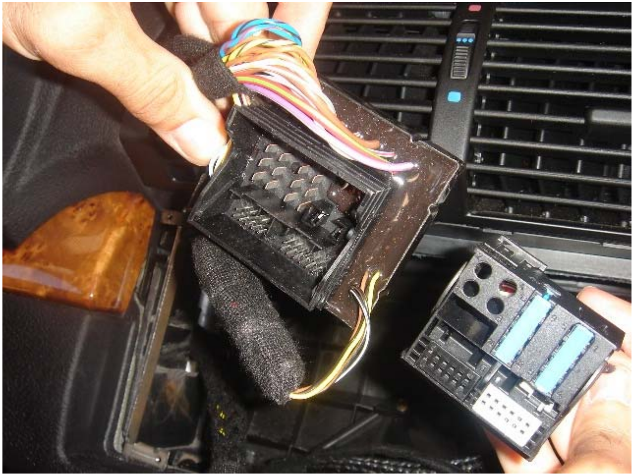
una imagen de las dos fichas conectadas: