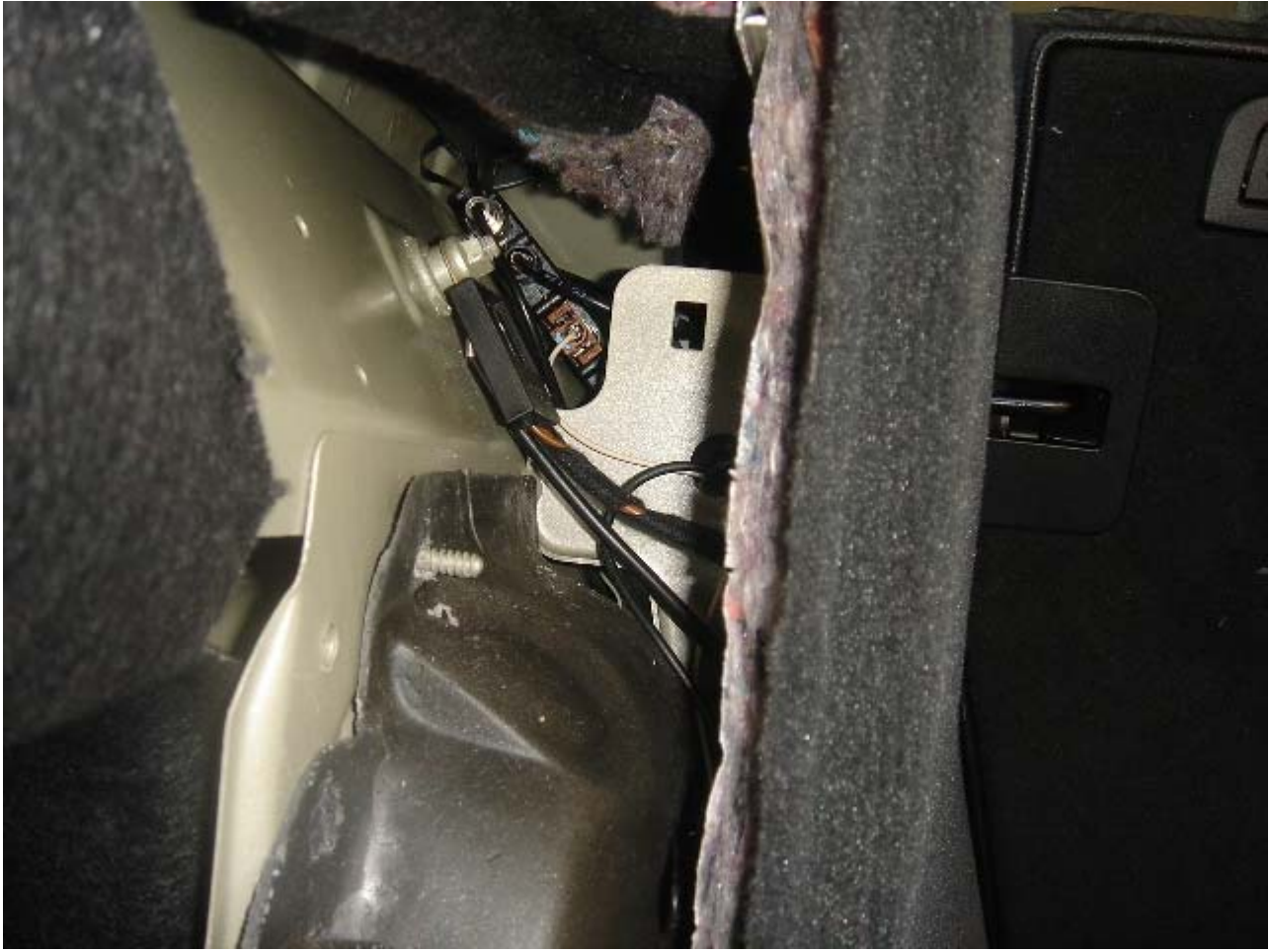
más de cerca la misma foto: