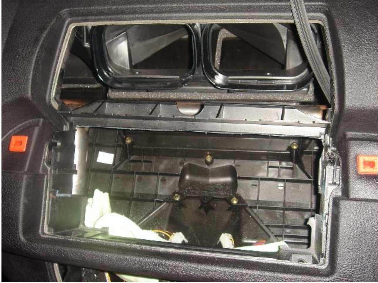
este es el soporte de la radio con cargador de cd que quitamos y en cuyo hueco metimos la pantalla: