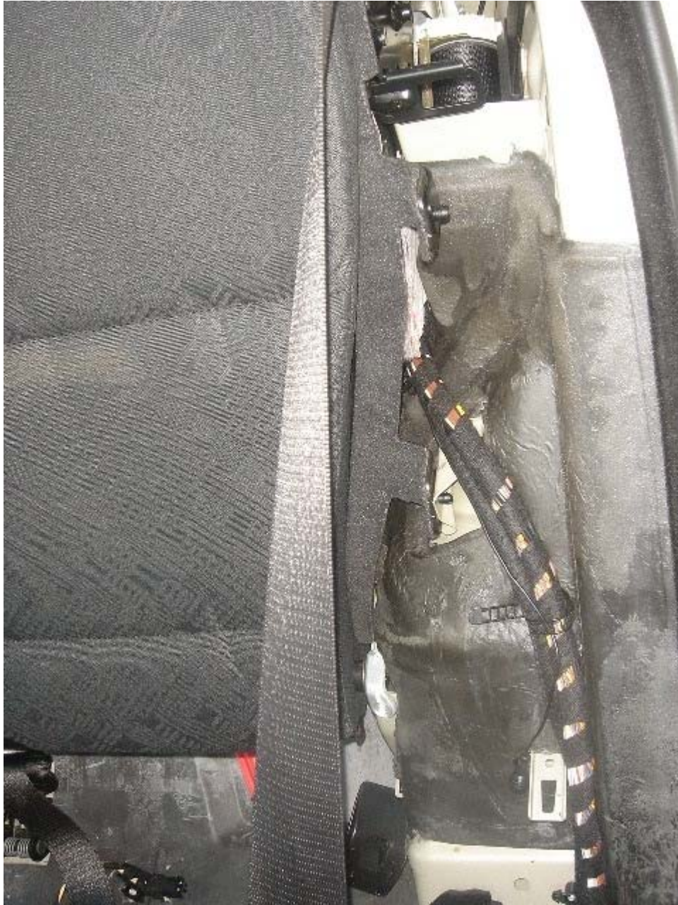
el cableado salió por debajo del embellecedor del maletero que ya habíamos desarmado con anterioridad: