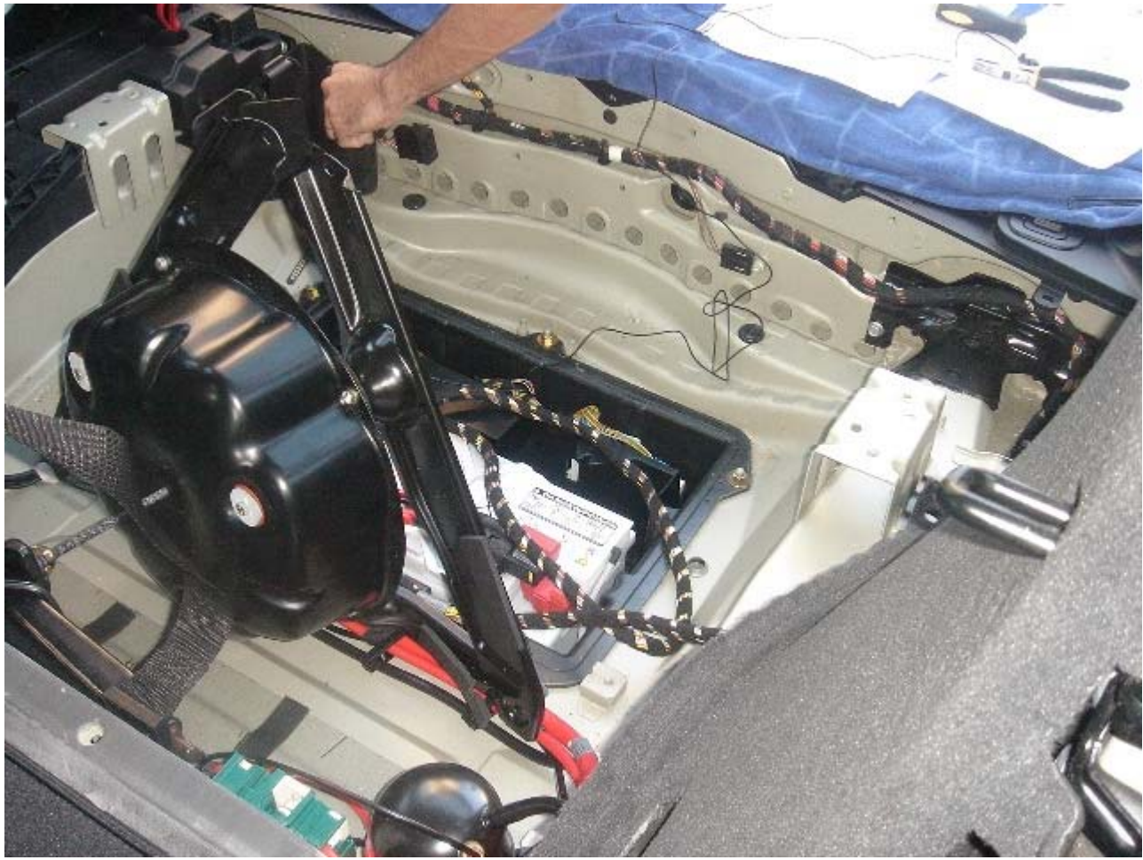
aquí vemos la radio en su ubicación: